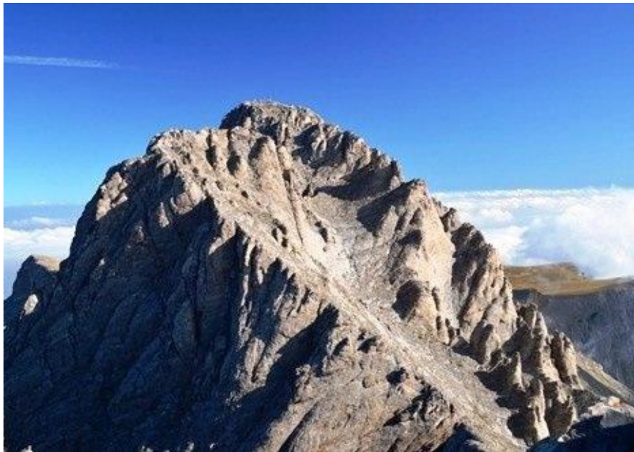
1 - Olimpo kalnas

Kova baigta, Dzeusas tampa vyriausiuoju dievu, jis iš naujo perskirsto teises ir sukuria hierarchišką, darnų pasaulį.