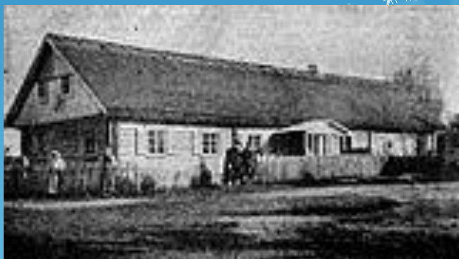
V. Kudirkos gimtoji sodyba Paežeriuose 1911 m.