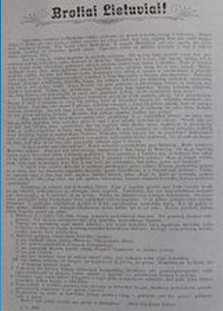
Vinco Kudirkos 1897 m. atsišaukimas