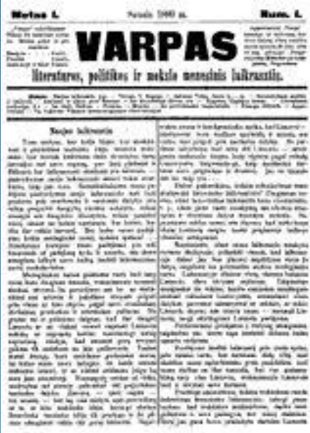
Varpas, 1889 m. Nr. 1