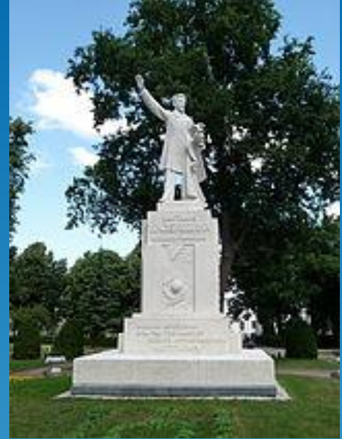
Paminklas Kudirkos Naumiestyje (skulpt. Vincas Grybas)