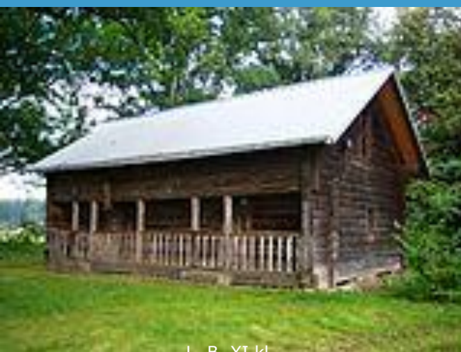
L. B. XI kl.