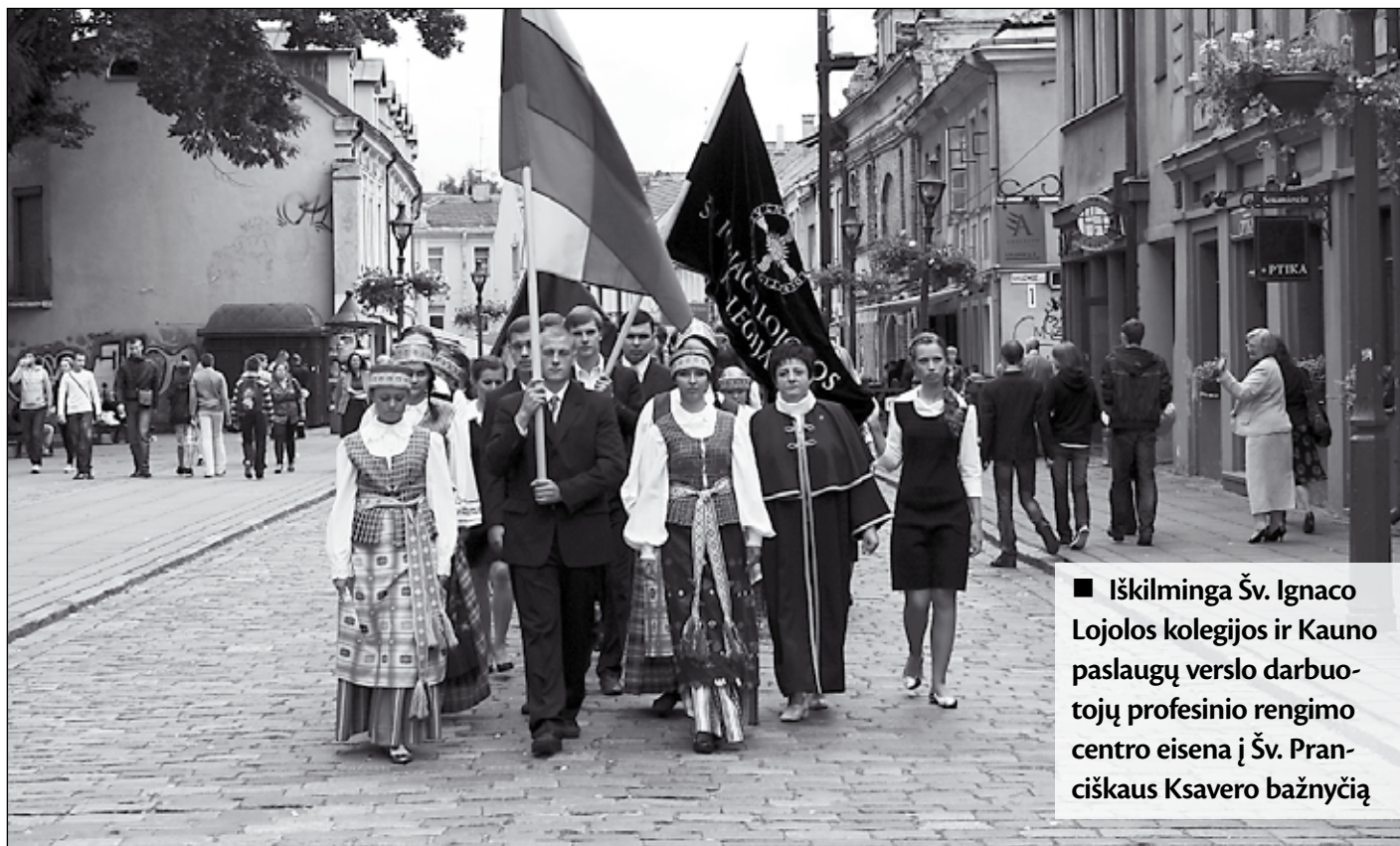
■ Iškilminga Šv. Ignaco Lojolos kolegijos ir Kauno paslaugų verslo darbuotojų profesinio rengimo centro eiseną į Šv. Pranciškaus Ksavero bažnyčią

Rugsėjo 1-ąją Kauno paslaugų verslo darbuotojų profesinio rengimo centro kiemyje susirinkusiems mokiniams skambėjo sveikinimo žodžiai, buvo pristatyti kolegijos, profesinio centro skyrių vedė-