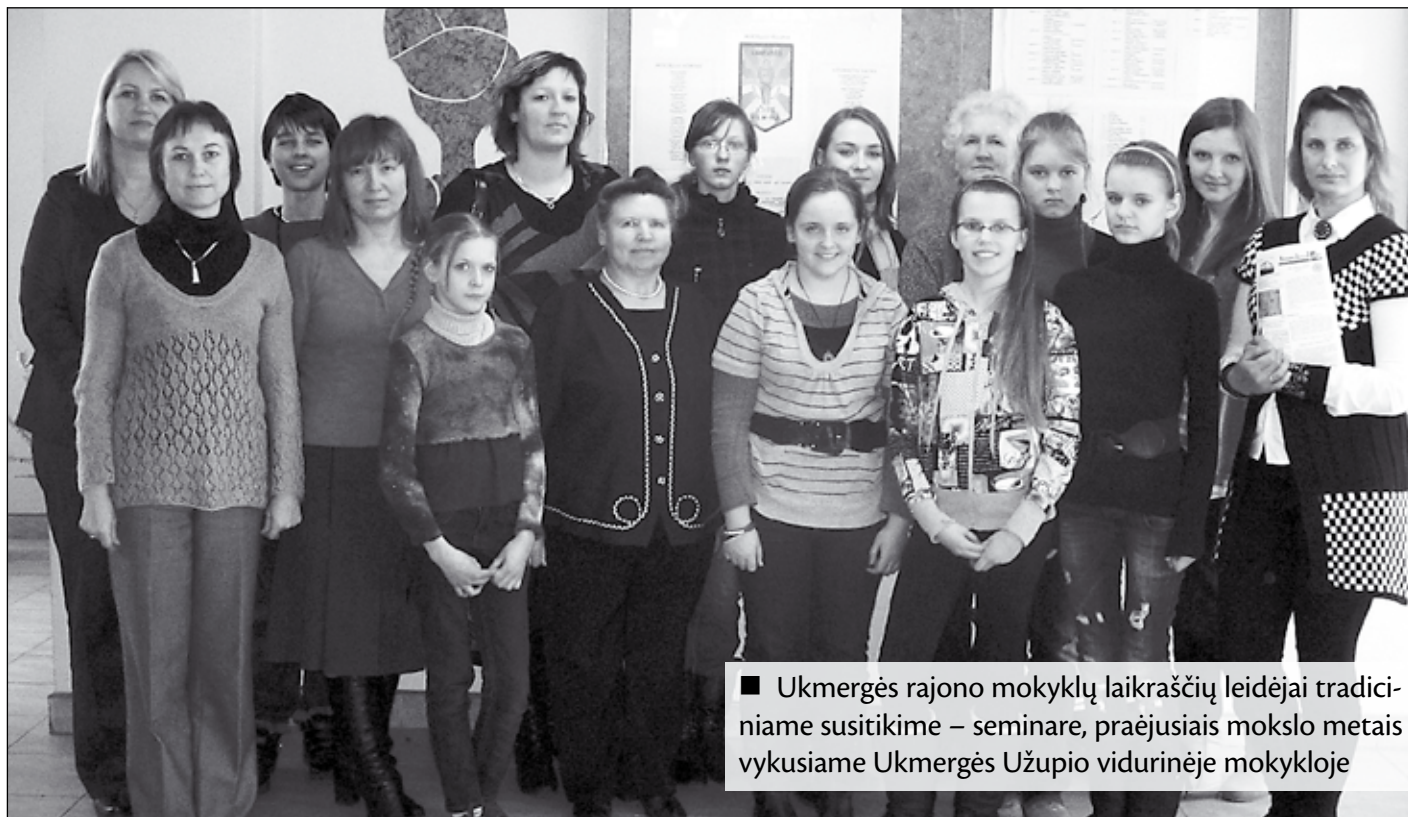
■ Ukmergės rajono mokyklų laikraščių leidėjai tradiciniame susitikime – seminare, praėjusiais mokslo metais vykusiame Ukmergės Užupio vidurinėje mokykloje

Vienareikšmiškai drįsčiau teigti, jog mokyklos laikraščio leidyba – daug laiko ir pastangų atimantis darbas. Kas reguliariai šia veikla užsiima, reikia manyti, tai irgi patvirtintų. Tad nenuostabu, jog ne vienas anksčiau leistas mokyklos leidinys tiesiog užgęsta. Tokią tendenciją pastaraisiais metais tenka pastebėti ir savo